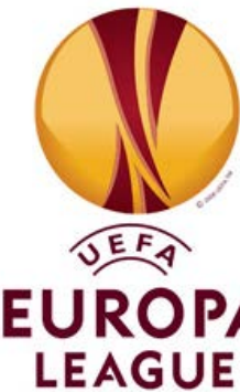
Sledovanosť (v tis) a podiel na trhu (%) zápasov Európska Liga (Dvojka RTVS); sezóna r. 2015 - 2016; CS 12+